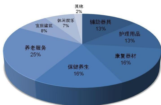
观众感兴趣的产品图