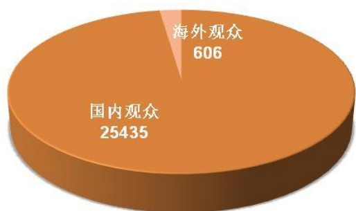
国内外观众数量图