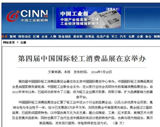
中国工业新闻网对展会进行报道