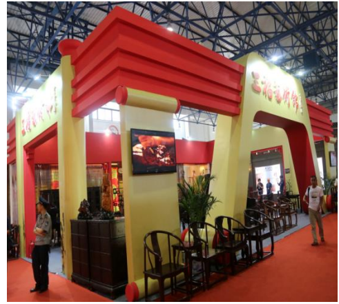
(首届中国现代实木家具生活体验展公共环境家具设计展览订货会)