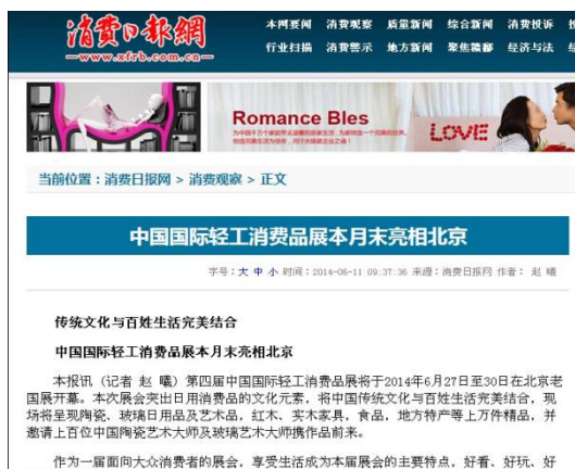
消费日报网对展会进行报道