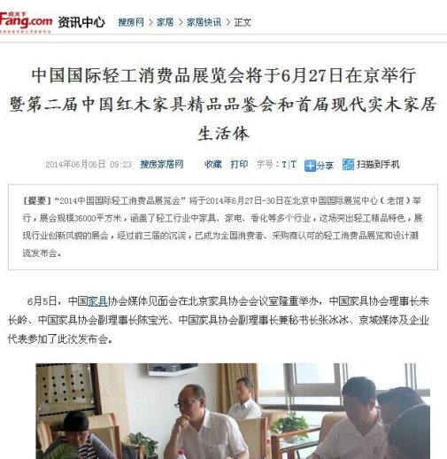
搜房网对展会进行报道