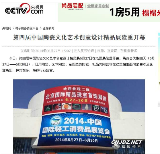
央视网对展会进行报道