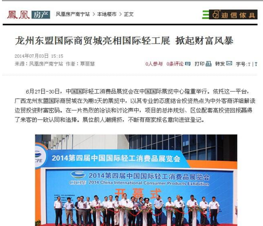
凤凰网对展会进行报道